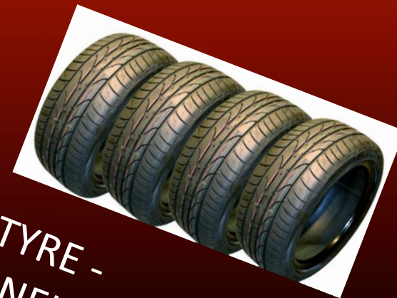
TYRE - PNEUMATIKA