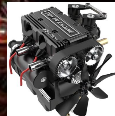
ENGINE - MOTOR