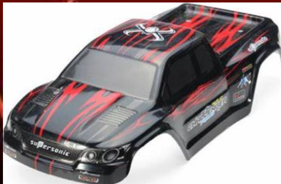
SHELL - KRYT