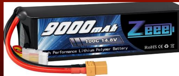
BATTERY - BATERIE